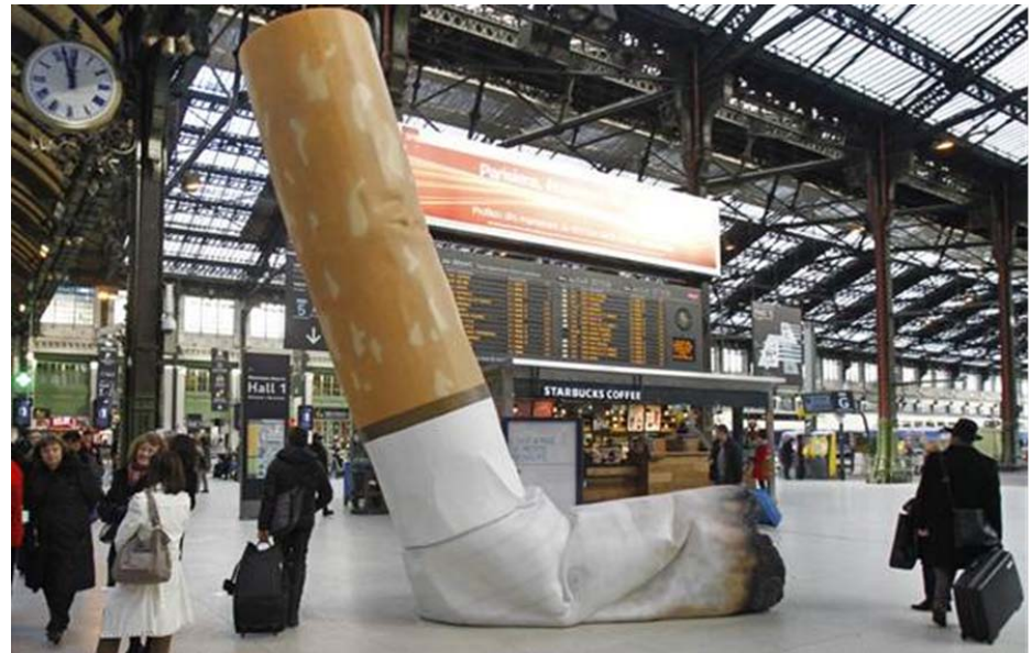
Gare de Lyon, Párizs