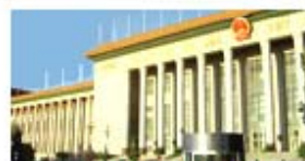
贯彻落实十七大精神