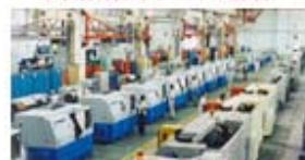
国家科技重大专项